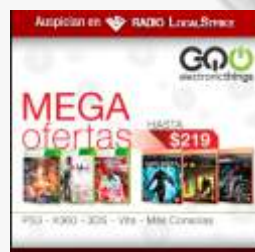
Medium Rectangle (300x250px)