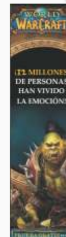
Wide Skycraper (160x600px)